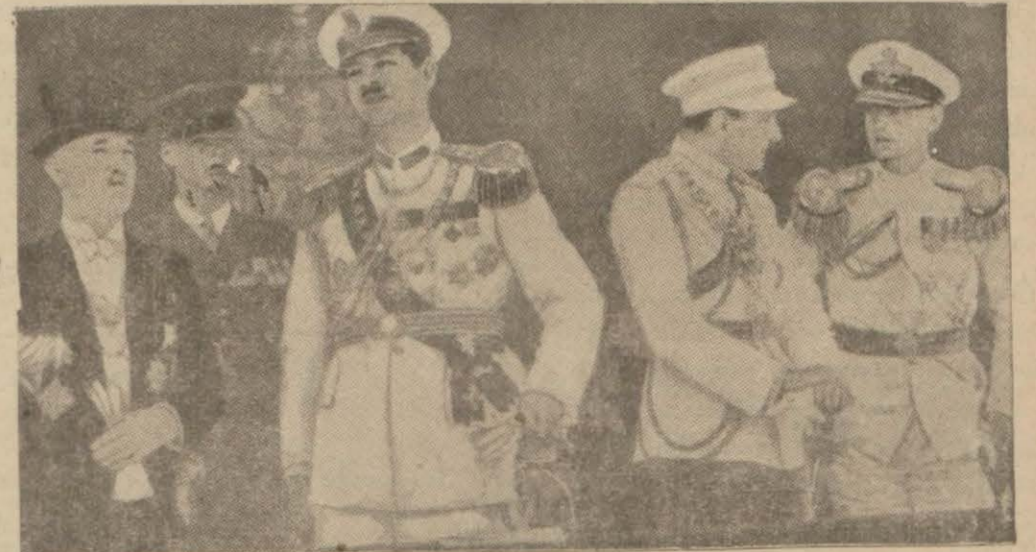
Bükreşte toplanan Küçük Antant devlet reisleri bir arada

Yugoslâv, Rumen ve Çek Erkânıharbiyeleri de ictimaa hazırlanıyorlar