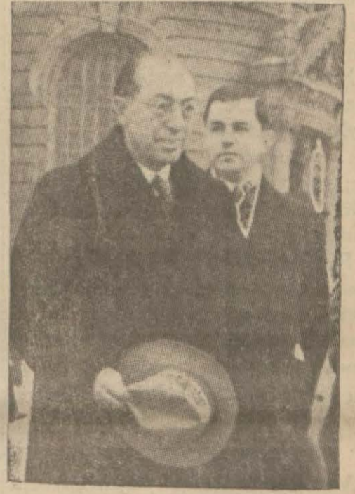
Tevfik Rüştü Aras