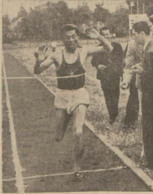
Dünkü koşulardan bir intiba

Senenin en mühim atletizm müsabakalarından biri dün Kadıköy stadında yapılmıştır.